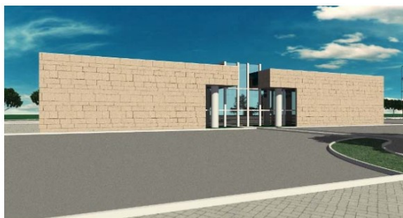
Padiglione Dedicato a TOSCOLEUM

Il Quartiere Fieristico è in parta campagna, lontano da aree urbane, i terreni circostanti al Centro Fiere, interamente agricoli, sono per la maggior parte destinati ad olivicoltura, di cui molti ettari coltivati in maniera intensiva e superintensiva. Inaugurato nel 2009 occupa un'area urbanizzata di oltre 45.000 mq, sulla quale sono stati edificati 3 edifici.